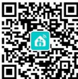
和家人公众号二维码