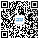
中国移动智慧家庭二维码